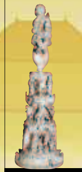
■ Säule des guten Hirten (Kunstwerk von Goa)