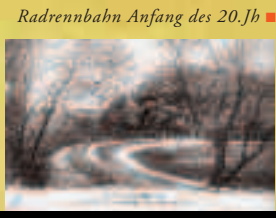
Radrennbahn Anfang des 20. Jh