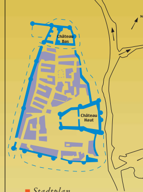
■ Stadtplan von Commercy im 15. und 16. Jh.