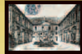
■ Commercy, Lehrerbildungsanstalt für Jungen im alten Prieuré de Breuil (1854-1962)