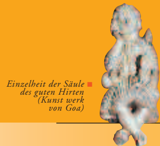
■ Einzelheit der Säule des guten Hirten (Kunstwerk von Goa)