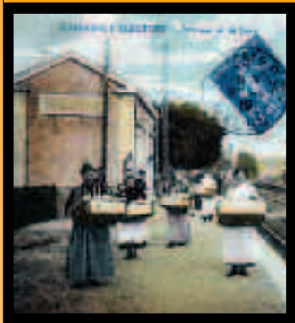
■ Die Madeleine-Verkäuferinnen auf dem Bahnsteig im Jahre 1912