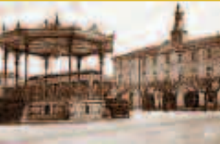
■ Place de l'Hôtel de Ville Der Rathausplatz gleich nach dem Zweiten Weltkrieg