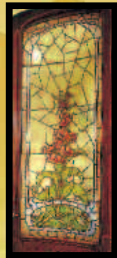
■ Bleigefasstes Jugendstilfenster der Apotheke im Stil der « Ecole de Nancy », der « Schule von Nancy ». Es wurde von Joseph Janin (1907) hergestellt.