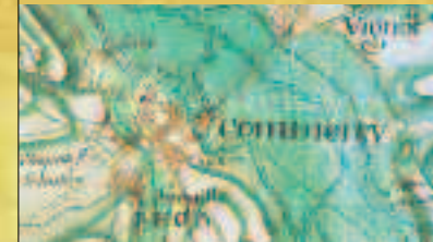
■ Commercy und Umgebung (Anfang des 18. Jh.)

l'Histoire ne retiendra que le nom de Stanislas qui prit possession de Commercy en 1745 et fit du château un "enchantement" pour ses visiteurs.