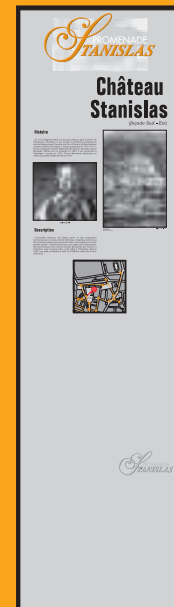
■ Hinweistafel, die den Rundweg kennzeichnet