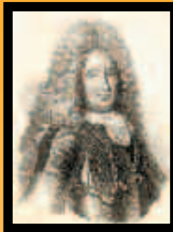
■ Charles Henri de Lorraine, Prinz von Vaudémont