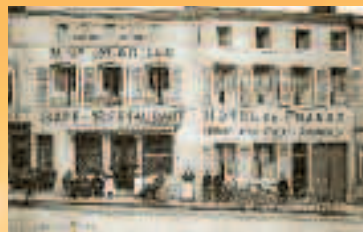
Geschäfte in der Rue Colson zu Beginn des 20. Jh.

Der Platz der Stiftsherren ist der ehemalige Platz Denis, auf dem die Stiftskirche Saint-Nicolas stand. In seiner Mitte befindet sich ein Brunnen von Amilcar Zannoni zu Ehren der Schmiede und Drahtzieher (1997). Sehenswert sind die Rue des Moulins (Nr. 6-8: vermutlich das Wohnhaus des Kardinals von Retz, erbaut 1596) und die Mitte der Rue de la Poterne (Kennzeichnung des Standorts der früheren Stadtmauer auf dem Boden).